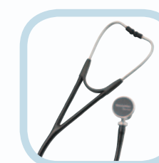
HARVEY DLX DOBBEL HODE STETOSKOP 5079-325