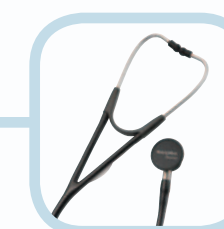
HARVEY ELITE DOBBEL HODE STETOSKOP 5079-125